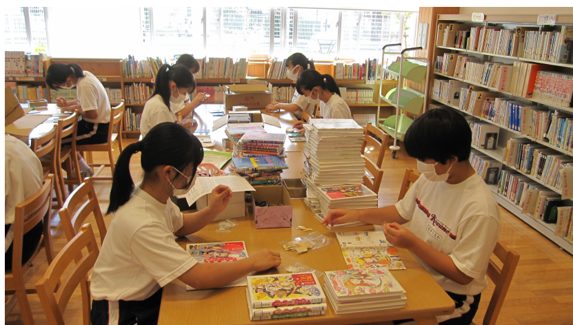
作業をする中学生ボランティア

を活用するとともに、改訂された学習指導要領にも謳われる「深い学び」の実現のため、校長のリーダーシップの下で教職員やボランティアが一体となって組織的、計画的な読書活動を推進することが重要です。