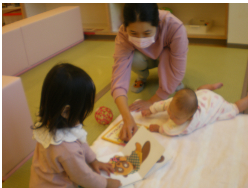
子育て支援センターの様子

また、各地域のコミュニティー組織や読書活動推進団体なども、子供の読書について深い関心を払いながら読書に親しむ様々な機会を提供していることから、子供の読書活動を推進する上で大きな役割が期待されています。