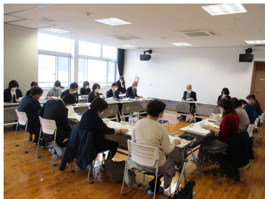
推進委員会の様子