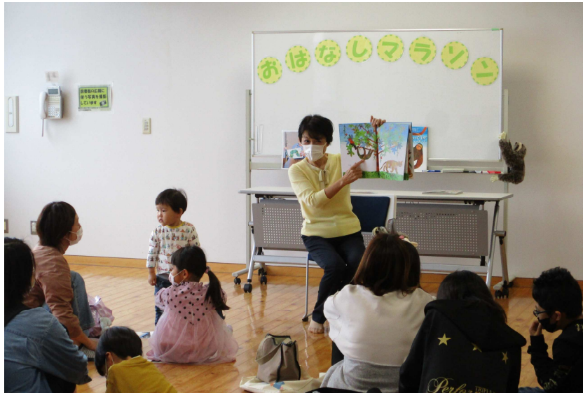
秋の読書週間行事「おはなしマラソン」

島田市の各図書館では、子供の年齢に応じた本を幅広く収集し、生涯を通じて自発的に本に親しむ基礎を作るとともに、自分で考え主体的に判断できる力を養えるよう、資料や情報を効果的に提供できる機能の充実に努めます。併せて、子供に関わる講座の開設、子供の行事に合わせた企画展示等、創意工夫を凝らした読書活動支援をすることで、子供たちのニーズに応じていきます。